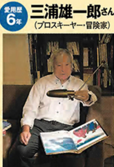
愛用歴6年 三浦雄一郎さん (プロスキーヤー・冒険家)