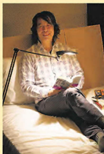
愛用歴11年 有栖川有栖さん (作家)