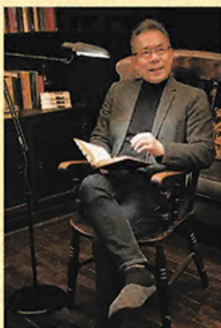
愛用歴2年半 藤沢周さん (作家)