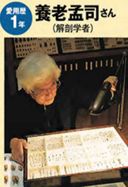
愛用歴1年 養老孟司さん (解剖学者)